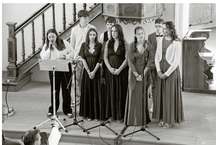
Konfirmation vom 10. Mai 2026 in der evang. Kirche Bussnang.